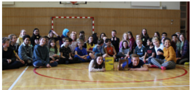
👁️ ↑ Alþjóðaskólinn í Garðabæ safnaði flestum undirskriftum miðað við nemendafjölda í herferðinni árið 2018.

Undanfarin ár hefur keppnin á grunnskólastigi farið fram í félagsmiðstöðvum víða um land. Árið 2018 varð breyting á þegar samkeppni var haldin meðal grunnskóla á landinu í stað félagsmiðstöðva. Sjö grunnskólar á landinu tóku þátt í fyrra og vonumst við til að fleiri skólar verði með í ár og að keppnin vaxi og dafni næstu árin.