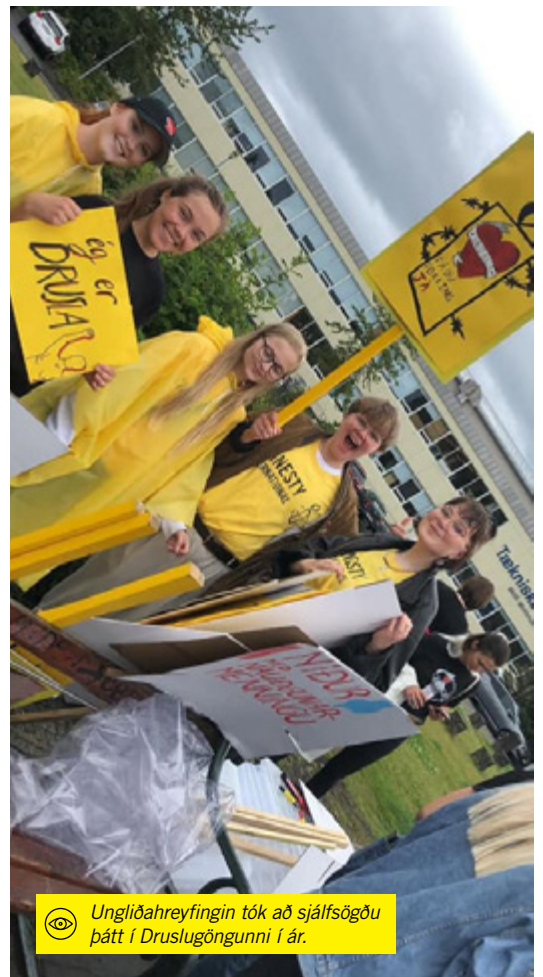
Ungliðahreyfingin tók að sjálfsögðu þátt í Druslugöngunni í ár.