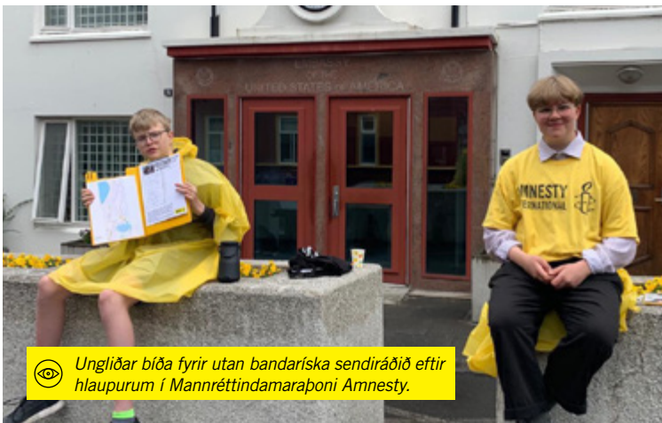
Ungliðar biða fyrir utan bandaríska sendiráðið eftir hlaupurum í Mannréttindamaraboni Amnesty.