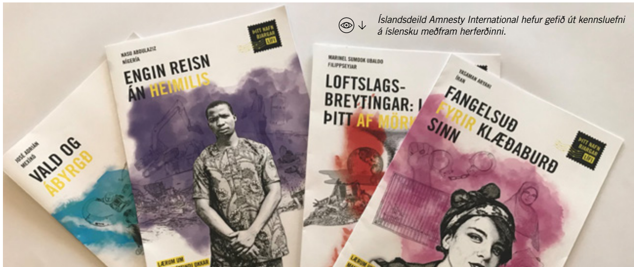
↓ Íslandsdeild Amnesty International hefur gefið út kennsluefni á íslensku meðfram herferðinni.