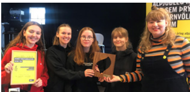
👁️ ↑ Nemendur Kvennó söfnuðu flestum undirskriftum allra framhaldsskóla árið 2018, alls 2.804.

Bréf til bjargar lífi 2018 (í ár Pitt nafn bjargar lífi) heppnaðist einstaklega vel þar sem söfnuðust 76.341 undirskriftir á Íslandi til stuðnings þolendum mannréttindabrota víða um heim. Þá hafa jákvæðar breytingar átt sér stað í nokkrum þeirra mála sem tekin voru fyrir í herferðinni í fyrra og sýnir það hve megnugur samtakamátturinn er. Kvennaskólinn í Reykjavík og Framhaldsskólinn á Laugum báru sigur úr bítum.