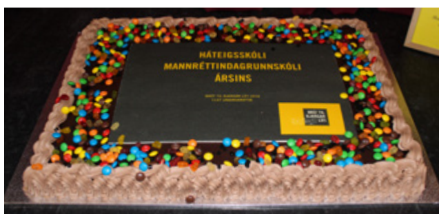
↑ Háteigsskóli safnaði flestum undirskriftum allra grunnskóla árið 2018, alls 1137.