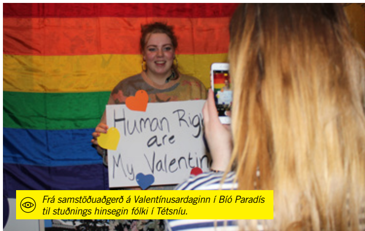
Frá samstöðuáæðgerð á Valentínusardaginn í Bíó Paradís til stuðnings hinsegin fólki í Tétsnú.

Árangur af starfi Amnesty International og mannréttinda-baráttunnar er margs konar. Lög eru sett til verndar mannréttindum, komið er í veg fyrir lagabreytingar sem ógna mannréttindum, réttlæti næst, aftökur eru stöðvaðar, fólk er leyst úr haldi og fyrirtækjum gert að virða mannréttindi. Þátttaka þín í mannréttindabaráttunni skiptir máli. Saman erum við sterkari.