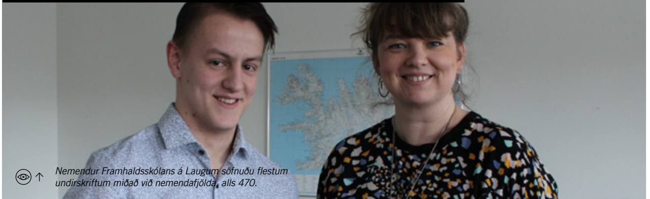
👁️ ↑ Nemendur Framhaldsskólans á Laugum söfnuðu flestum undirskriftum miðað við nemendafjölda, alls 470.

TÆKIFÆRI FYRIR UNGT FÓLK TIL AÐ GRÍPA TIL AÐGERÐA