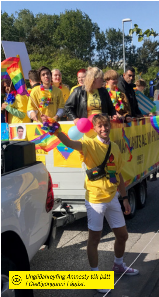
Ungliðahreyfing Amnesty tók þátt í Gleðigöngunni í ágúst.