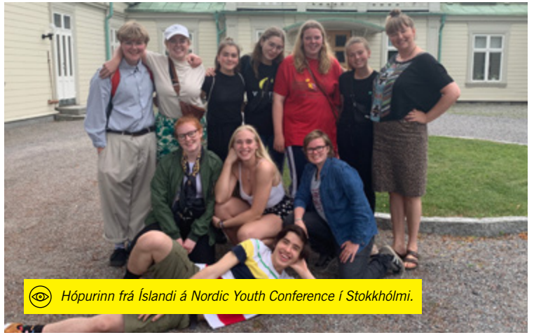
Hópurinn frá Íslandi á Nordic Youth Conference í Stokkhólmi.