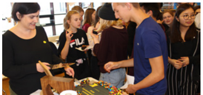
👁️ ↑ Nemendum var auðvitað boðið upp á köku í tilefni dagsins.

Undanfarin ár hefur keppnin á grunnskólastigi farið fram í félagsmiðstöðvum víða um land. Árið 2018 varð breyting á þegar samkeppni var haldin meðal grunnskóla á landinu í stað félagsmiðstöðva. Sjö grunnskólar á landinu tóku þátt í fyrra og vonumst við til að fleiri skólar verði með í ár og að keppnin vaxi og dafni næstu árin.