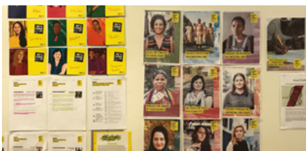
↑ Nemendur í Alþjóðaskólanum í Garðabæ verja góðum tíma ár hvert í að kynna sér málin í herferðinni.

Háteigsskóli fór með sigur af hólmi sem Mannréttinda-grunnskóli ársins 2018 og safnaði 1.137 undirskriftum en nemendur skólans voru heldur betur kröftugir og gengu í hús og fyrirtæki í nágrenninu, kynntu málin og söfnuðu undirskriftum. Þá hlaut Alþjóðaskólinn á Íslandi viðurkenningu fyrir flestar undirskriftir miðað við nemendafjölda en skólinn safnaði 571 undirskrift. Að auki skrifuðu nemendur Alþjóðaskólans 61 bréf til stjórnvalda og stuðningskveðjur til þolenda.