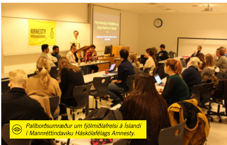
Pallborðsumræður um fjölmiðlafrelsi á Íslandi í Mannréttindaviku Háskólafélags Amnesty.