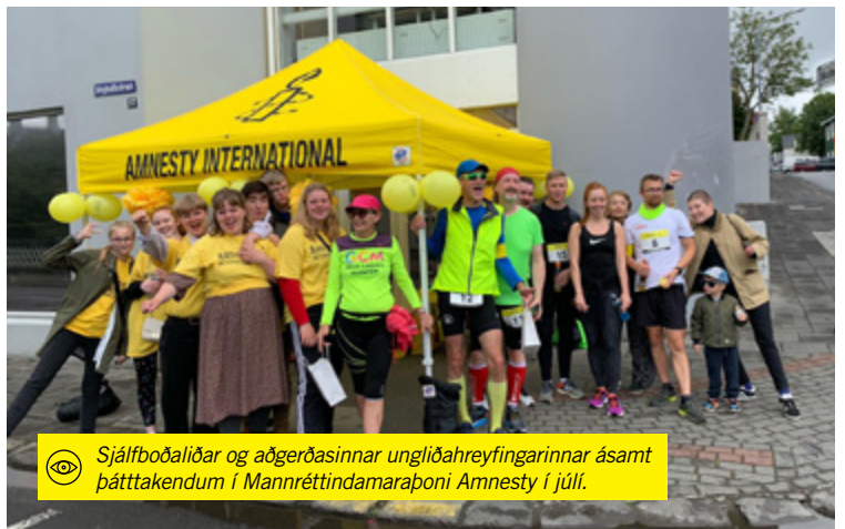
Sjálfbodaliðar og aðgerðasinnar ungliðahreyfingarinnar ásamt þátttakendum í Mannréttindamaraboni Amnesty í júlí.