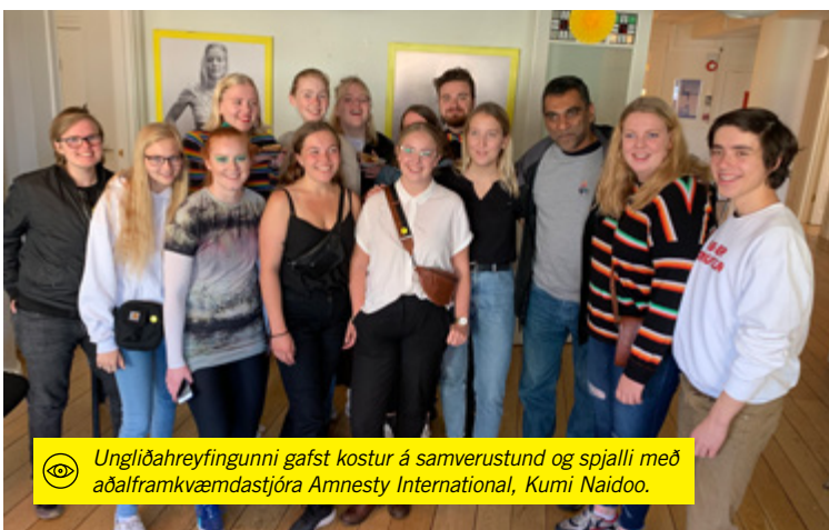
Ungliðahreyfingunni gafst kostur á samverustund og spjalli með aðalframkvæmdastjóra Amnesty International, Kumi Naidoo.