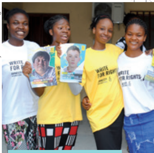
Amnesty Nigeria activists participate in Write for Rights 2021.

Kynntu þér málin í ár á vefsíðu okkar : www.amnesty.is