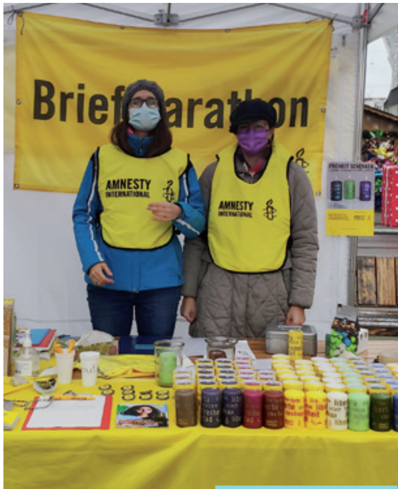
Amnesty Switzerland activists participate in Write for Rights 2021.

Mannréttindi eru ekki munaður sem fólk fær aðeins að njóta þegar aðstæður leyfa.