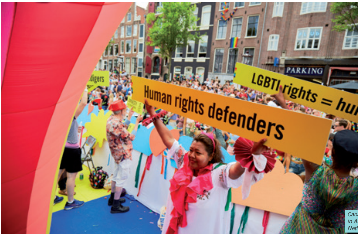
Canal Pride Parade in Amsterdam, the Netherlands, 2018.

Ef tími gefst til er hægt að sýna þolendum samstöðu með því að skrifa þeim og/eða fjölskyldu þeirra stuðningskveðju.