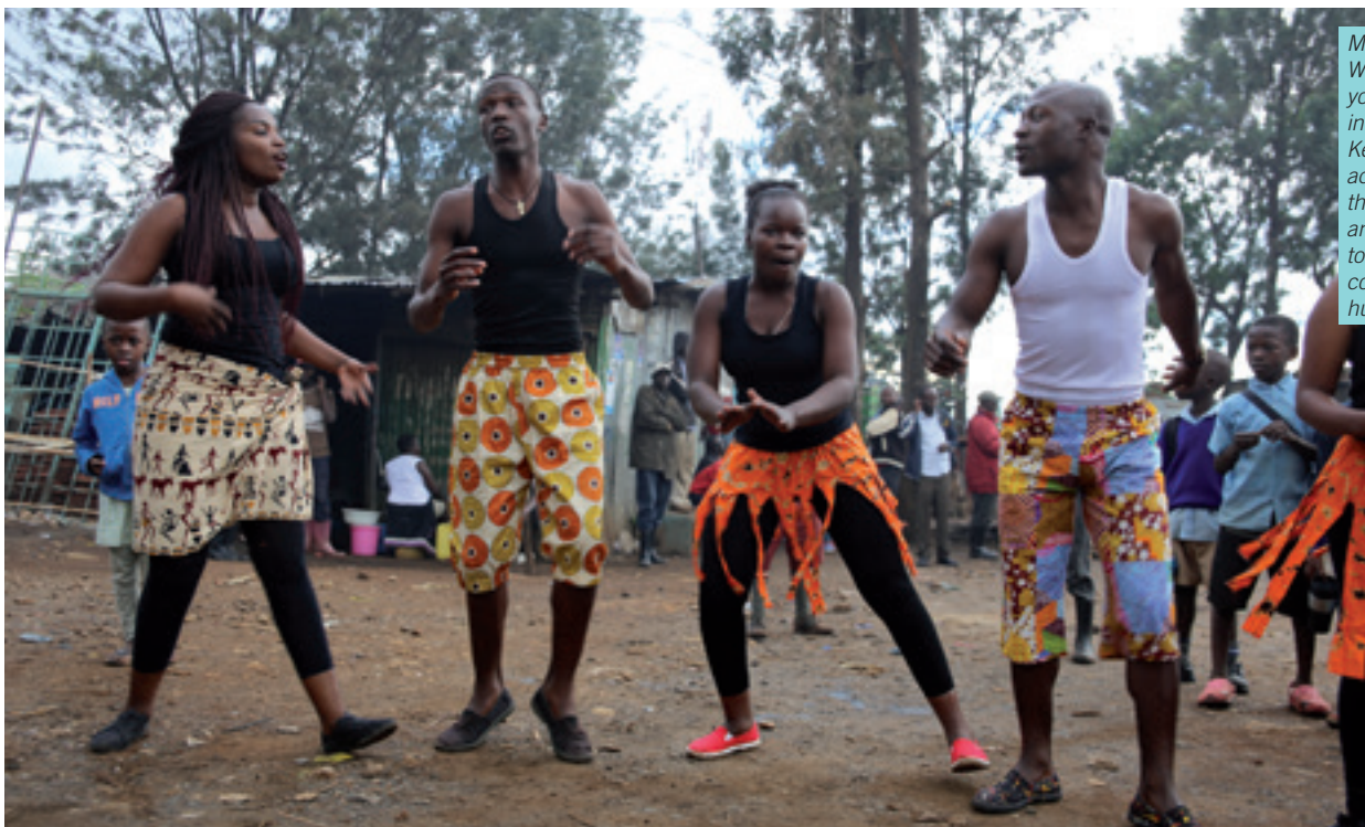
Members of the Wasanii Sanaa youth organization in Kibera slum, Kenya, use action-packed theatre, poetry and dance to teach the community about human rights.

Ef þetta er í fyrsta sinn sem þátttakendur vinna með Mannréttindayfirlýsingu Sameinuðu þjóðanna er mikilvægt að kynna þeim hana stuttlega áður og nota til þess upplýsingarnar á bls. 4.