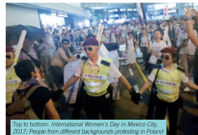
Top to bottom: International Women's Day in Mexico City, 2017; People from different backgrounds protesting in Poland in 2019 in solidarity with judges and prosecutors; Despite a violent crackdown on protests, these Sudanese women demonstrated in large numbers in 2019; Protesters dressed as police at a pro-democracy march in Hong Kong in 2014.