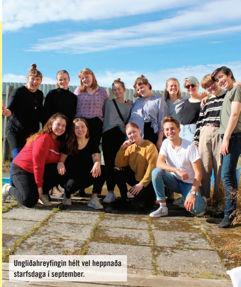
Ungliðahreyfingin hélt vel heppnaða starfsdaga í september.

Sjö manna stjórn hreyfingarinnar hefur verið drifkraftur í skipulagi, framkvæmd og hvatningu til annarra meðlima til þátttöku og á hún mikið hrós skilið. Eldmóður, elja og dugnaður einkenna starf og þátttöku allra sem koma að ungliðahreyfingunni þar sem brennandi áhugi á mannréttindum og bættum heimi er aðaleldsneyti þátttakenda.