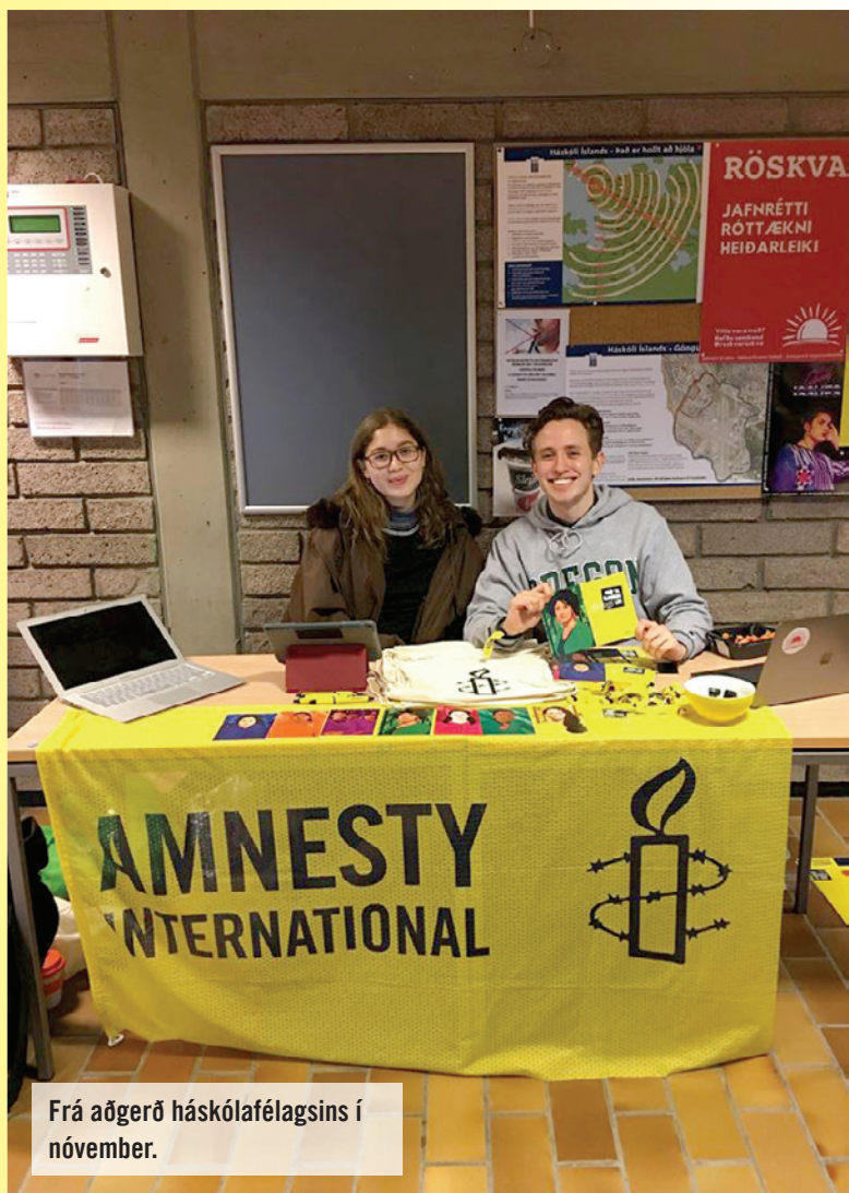
Frá aðgerð háskólafélagsins í nóvember.