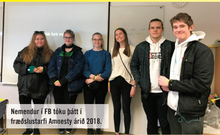
Nemendur í FB tóku þátt í fræðslustarfi Amnesty árið 2018.

Kennsluheftið Réttindi og virðing má nýta til að valdefla nærsamfélagið til að taka vel á móti flóttafólki og farandfólki.