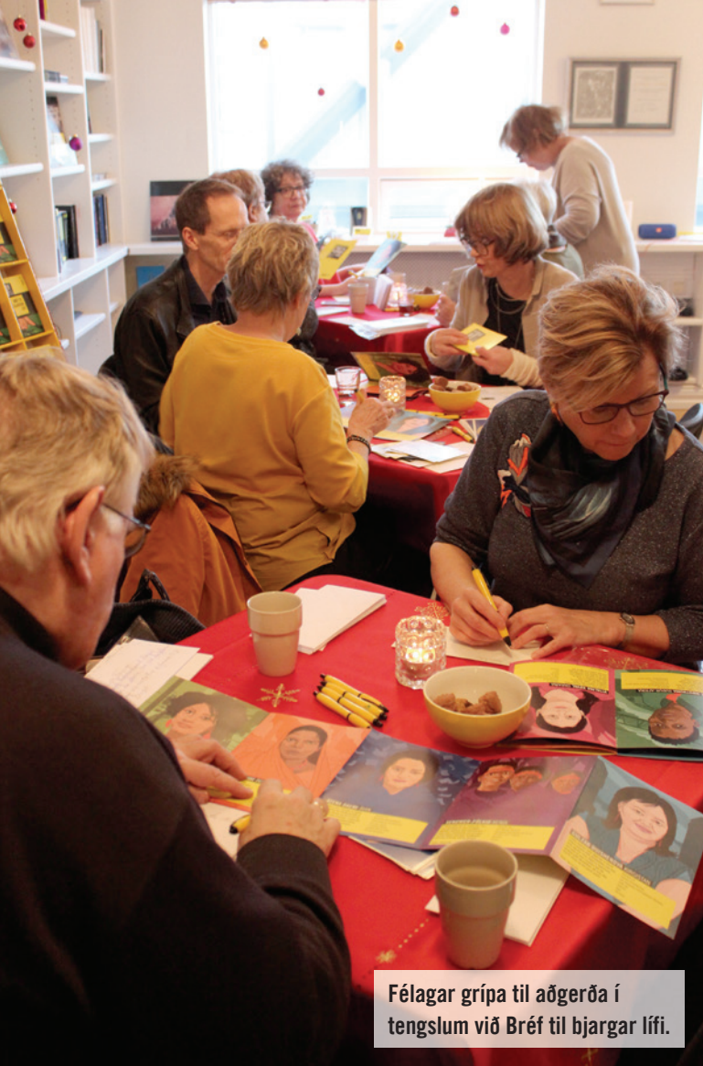
Félagar grípa til aðgerða í tengslum við Bréf til bjargar lífi.